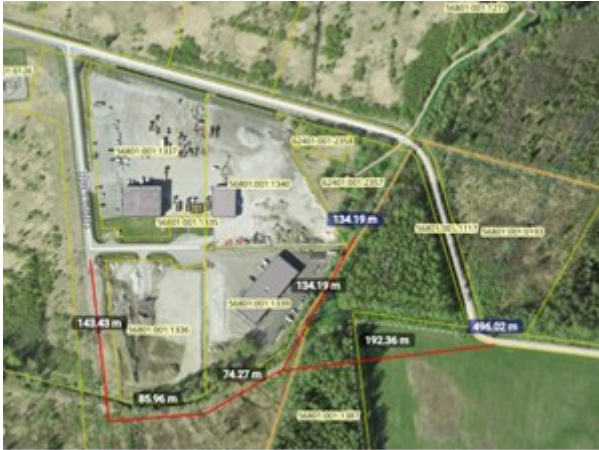
Joonis 1. Alternatiivne teekoridor Maa-ameti kaardi väljavõttel.